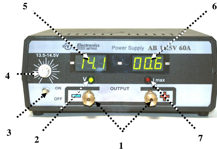
Рис. 2. Расположение органов управления на передней панели источника питания

На передней панели источника питания размещены оперативные органы управления, цифровые индикаторы встроенных измерительных приборов вольтметра и амперметра, светодиодные индикаторы режимов работы и выходные клеммы. На рис. 2 показан внешний вид передней панели прибора и расположение на ней всех органов управления и индикации.