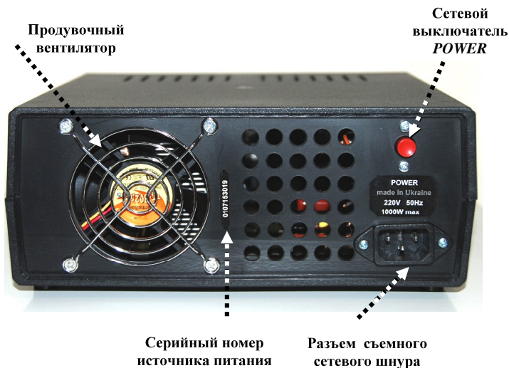
Рис. 3. Расположение органов управления на задней панели источника питания

На задней панели (рис. 3) находятся сетевой выключатель "POWER", продувочный вентилятор, разъем съемного сетевого шнура питания, серийный номер источника питания.