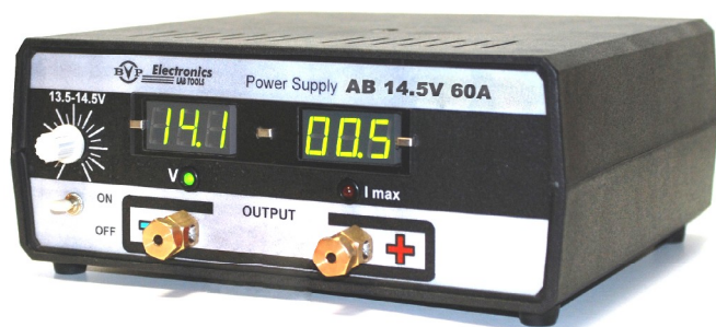
Рис. 1. Импульсный источник питания постоянного тока для работы с аккумуляторными батареями BVP AB 14.5V/60A